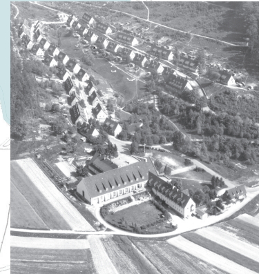
Luftbild Waldhof vor 1960