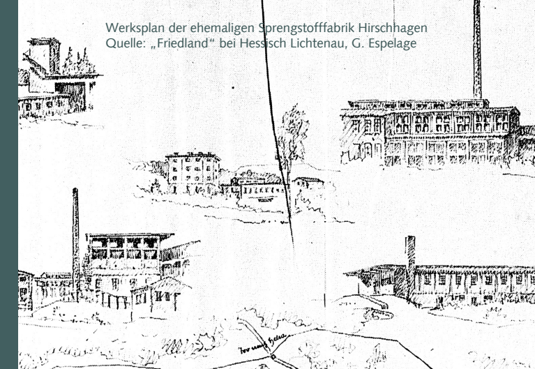
Werksplan der ehemaligen Sprengstofffabrik Hirschhagen Quelle: „Friedland“ bei Hessisch Lichtenau, G. Espelage