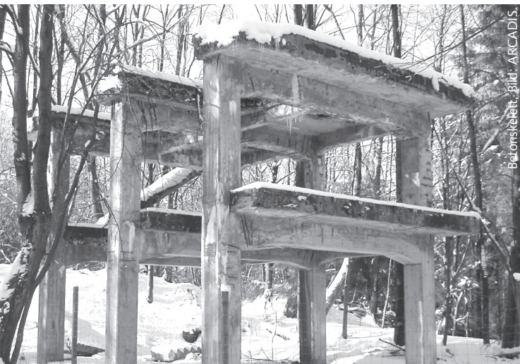
Betonstele, Bild: ARCADIS