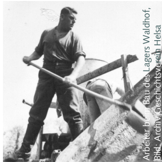
Arbeiter beim Bau des Lagers Waldhof.